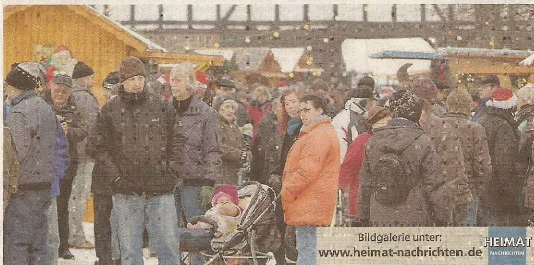
Bildgalerie unter: www.heimat-nachrichten.de HEIMAT NACHRICHTEN

Neuentaler Weihnachtsmarkt erfreute herzlich